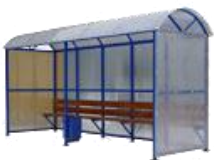
"КУРИЛКА КМ-1/Б" ПАВИЛЬОН ДЛЯ КУРЕНИЯ