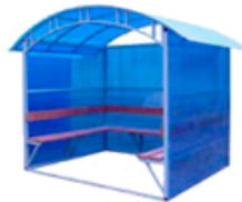
"КУРИЛКА КМ-3" ПАВИЛЬОН ДЛЯ КУРЕНИЯ