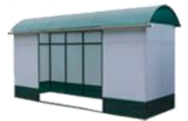
"КУРИЛКА КМ-6" ПАВИЛЬОН ДЛЯ КУРЕНИЯ