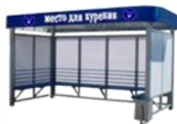
"КУРИЛКА КМ-5" ПАВИЛЬОН ДЛЯ КУРЕНИЯ