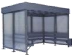
"КУРИЛКА КМ-10" ПАВИЛЬОН ДЛЯ КУРЕНИЯ