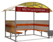
"КУРИЛКА КМ-7 Р" ПАВИЛЬОН ДЛЯ КУРЕНИЯ