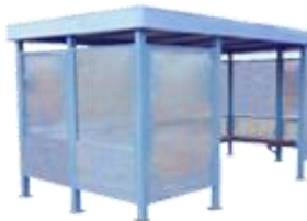
"КУРИЛКА КМ-11" ПАВИЛЬОН ДЛЯ КУРЕНИЯ