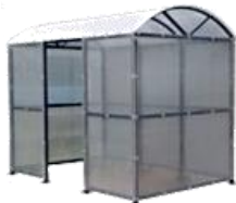
"КУРИЛКА КМ-2" ПАВИЛЬОН ДЛЯ КУРЕНИЯ