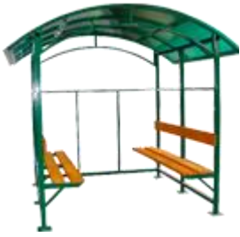
ПАВИЛЬОН ДЛЯ КУРЕНИЯ В ВИДЕ НАВЕСОВ "КУРИЛКА КМ-9" ПАВИЛЬОН ДЛЯ КУРЕНИЯ В ВИДЕ НАВЕСОВ