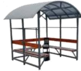
"КУРИЛКА КМ-8" ПАВИЛЬОН ДЛЯ КУРЕНИЯ