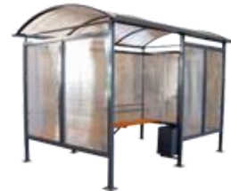
"КУРИЛКА КМ-4" ПАВИЛЬОН ДЛЯ КУРЕНИЯ