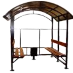
"КУРИЛКА КМ-9 У" ПАВИЛЬОН ДЛЯ КУРЕНИЯ В ВИДЕ НАВЕСОВ