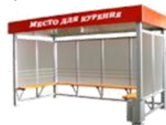
"КУРИЛКА КМ-5 С" ПАВИЛЬОН ДЛЯ КУРЕНИЯ