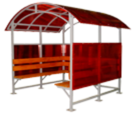
"КУРИЛКА КМ-8/3" ПАВИЛЬОН ДЛЯ КУРЕНИЯ