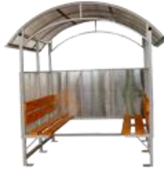
"КУРИЛКА КМ-9/2" ПАВИЛЬОН ДЛЯ КУРЕНИЯ