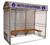
"КУРИЛКА КМ-1" ПАВИЛЬОН ДЛЯ КУРЕНИЯ