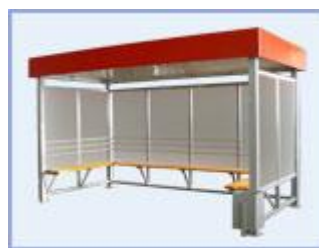
Автобусная остановка OM-13 Городская (стекло триплекс) двухстенная трехстенная