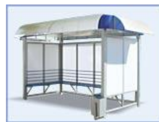
Автобусная остановка OM-9 Городская (поликарбонат) трехстенная двухстенная