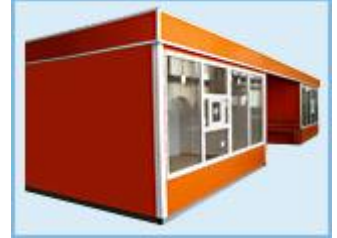
Торгово - остановочный павильон 2КО-ОТМ-7