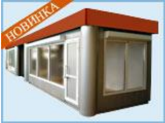
Торгово - остановочный павильон 2КО-ПЛЮС