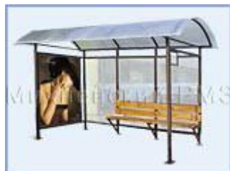
Автобусная остановка с рекламным табло OM-6 (стекло триплекс)