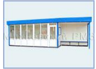
Торгово - остановочный павильон ОТМ-3