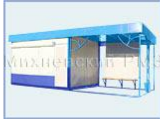
Торгово - остановочный павильон ОТМ-5