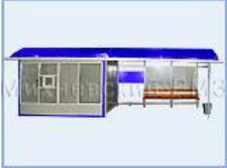
Торгово - остановочный комплекс "ОТМ-1"