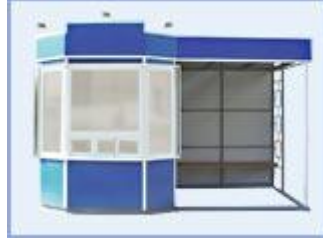
Торгово - остановочный павильон ОТМ-4