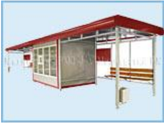
Торгово - остановочный комплекс "ОКО"