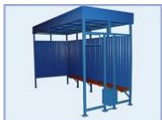
Остановочный павильон (автобусная остановка) OM-16