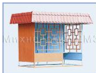
Автобусная остановка OM-3