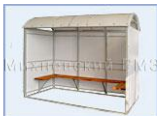
Павильон для курения "Курилка" (поликарбонат)