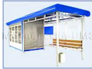
Торгово - остановочный комплекс "ОТМ-6"