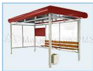
Автобусная остановка OM-8 Городская (стекло триплекс) двухстенная трехстенная