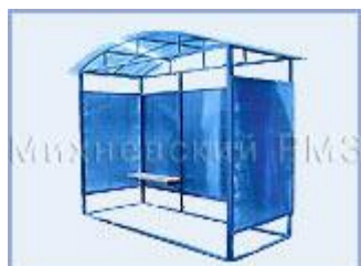
Автобусная остановка OM-4 (поликарбонат)