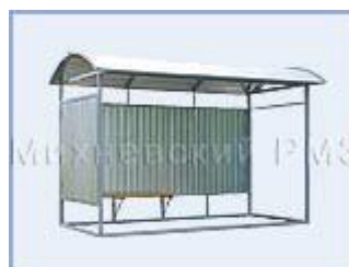
Автобусная остановка OM-1