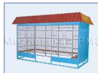
Автобусная остановка OM-3/K