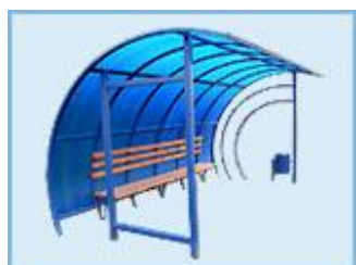
Автобусная остановка OM-11 (поликарбонат или стекло триплекс)