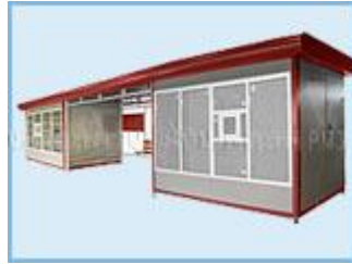
Торгово - остановочный комплекс "2КО"