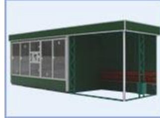
Торгово - остановочный павильон ОТМ-7