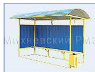
Автобусная остановка OM-2