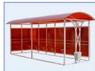
Автобусная остановка OM-12 (поликарбонат)