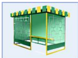
Автобусная остановка OM-7 "Антивандальная"