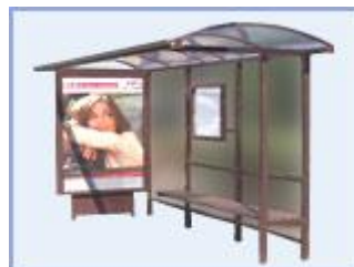
Автобусная остановка УСИЛЕННЫЙ КАРКАС OM-15 (стекло триплекс)