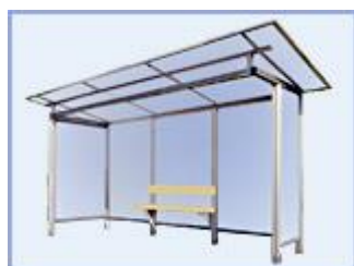
Автобусная остановка OM-14