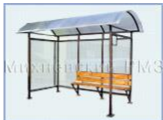
Автобусная остановка OM-5 (стекло триплекс)