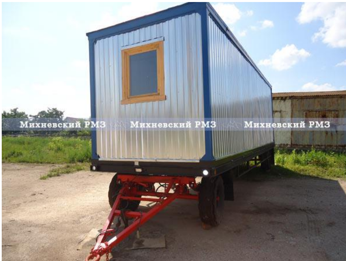
Фото пережвижных бытовок, вагон - домов БШП-6/8: